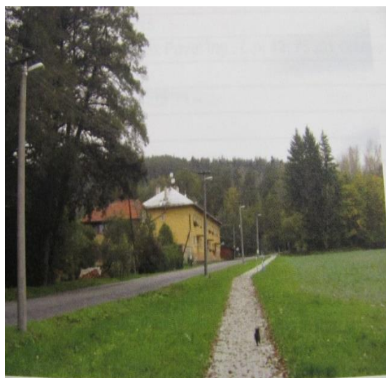
Cesta kolem chodníku před výsadbou