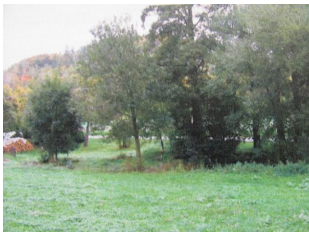
Plocha u potoka před výsadbou

V únoru roku 2017 podal starosta obce žádost o poskytnutí dotace na oba projekty na Státní fond životního prostředí ČR dle podmínek Národního programu Životní prostředí. Celkové způsobilé náklady dle projektu činily 780 172 Kč. Naše žádost byla úspěšná a obci byla poskytnuta dotace z těchto požadovaných nákladů 80% tj. 624 138 Kč.