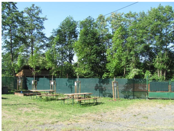
Javory u klubovny rybářů

V roce 2020 byla provedena také částečná výsadba dle projektu 5 Klubovna rybářů 5 kusů javor mleč (ACER PLATANOIDES). Byly nahrazeny stávající olše, které byly značně poškozeny. Výsadba byla uhrazena z prostředků obce Olšovec ve výši 32 000,- Kč.