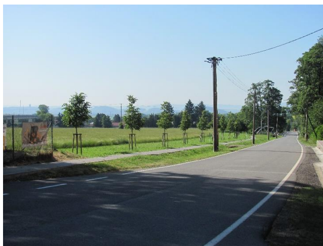
Lipová alej po výsadbě

V říjnu 2018 byla po výběrovém řízení podepsána smlouva s firmou FORESTER SERVIS s. r. o., která celou výsadbou realizovala dle výběrového řízení za částku 822 094,58 Kč. Rozdíl mezi cenou dle výběrového řízení a dotací hradila obec ze svého rozpočtu. Práce byly započaty 1. 3. 2019 a dokončeny 19. 8. 2020 dle předávacího protokolu.