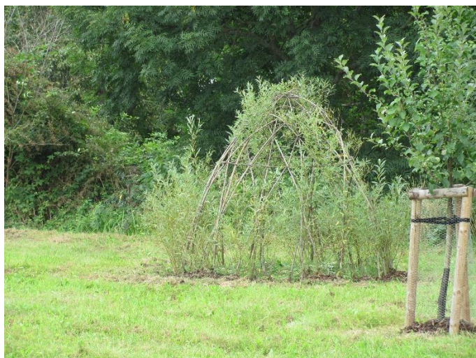
Zajímavostí je tzv. Vrbová stavba