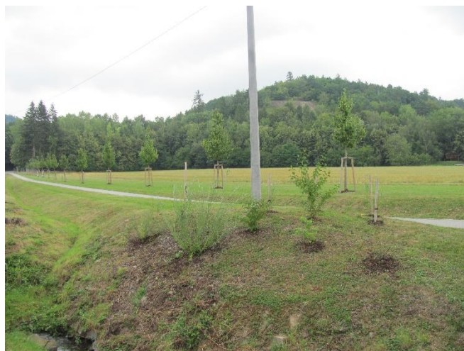
Plocha u lávky po výsadbě