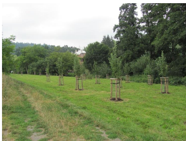
Plocha u potoka po výsadbě